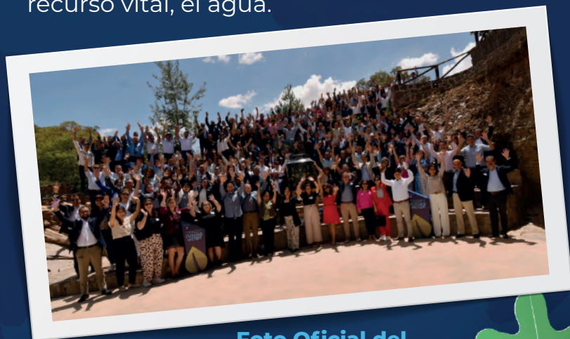
Foto Oficial del Evento

"Estrategias de mercadotecnia y promoción efectivas para escalar el WaterCredit".